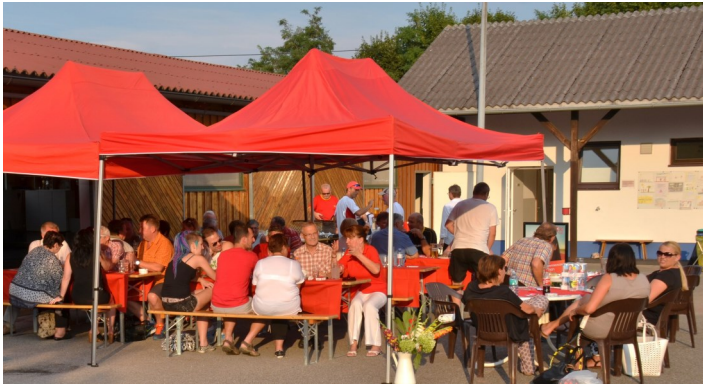
Gute Stimmung bei allen Besuchern des Festes