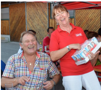
Auch die neuen Wahlkampfplakate wurden präsentiert