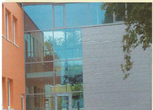
Baubeginn im Mai