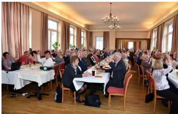
Der bis zum letzten Platz gefüllte Saal.