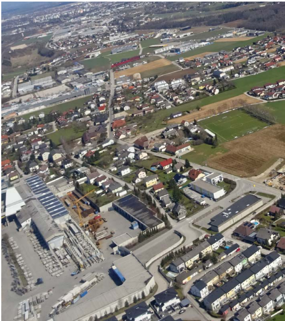
Das Luftbild zeigt das wachsende Wohngebiet zwischen Westbahn und B 1 (Ortsteil Straß).

Am früheren Billa-Standort in der Gärtnerstraße errichtet EW-Bau 21 Eigentumswohnungen. Zahlreiche neue Einfamilien- und Reihenhäuser sowie Wohnungen entstehen auch im Osten, zwischen Heidestraße und B1. In Irnharting sind weitere 35 Bauparzellen mit Einzel- und Doppelhäusern geplant. Großflächig wird auch in Oberndorf für Wohnbauten umgewidmet.